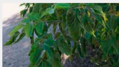
Ošlapu kļava Acer negundo