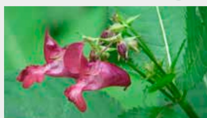
Puķu sprigane Impatiens glandulifera