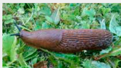
Spānijas kailgliemezis Arion vulgaris