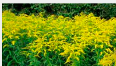
Kanādas zeltgalvīte Solidago canadensis