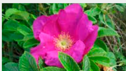
Krokainā roze Rosa rugosa