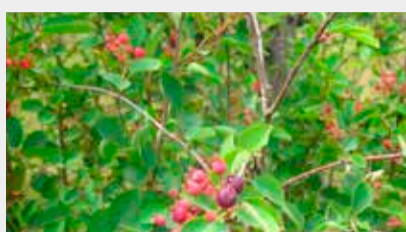
Vārpainā korinte Amelanchier spicata