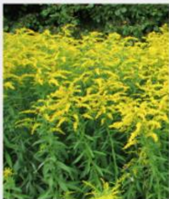
Kanādas zeltgalvīte Solidago canadensis