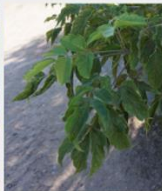
Ošlapu kļava Acer negundo