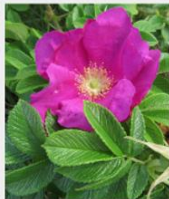
Krokainā roze Rosa rugosa