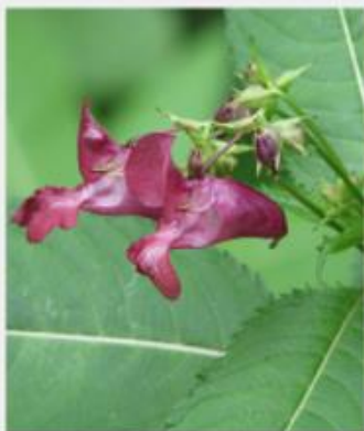
Puķu sprigane Impatiens glandulifera