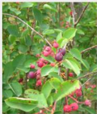
Vārpainā korinte Amelanchier spicata