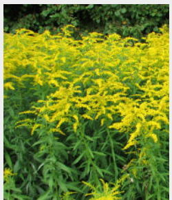
Kanādas zeltgalvīte Solidago canadensis