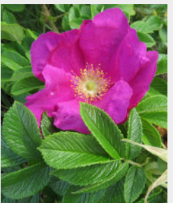
Krokainā roze Rosa rugosa