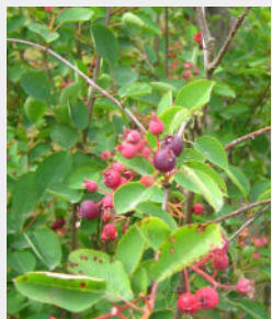
Vārpainā korinte Amelanchier spicata