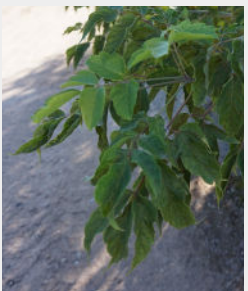
Ošlapu kļava Acer negundo