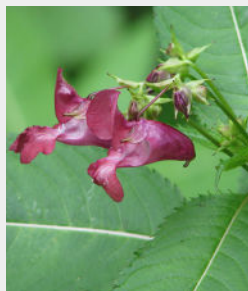
Puķu sprigane Impatiens glandulifera